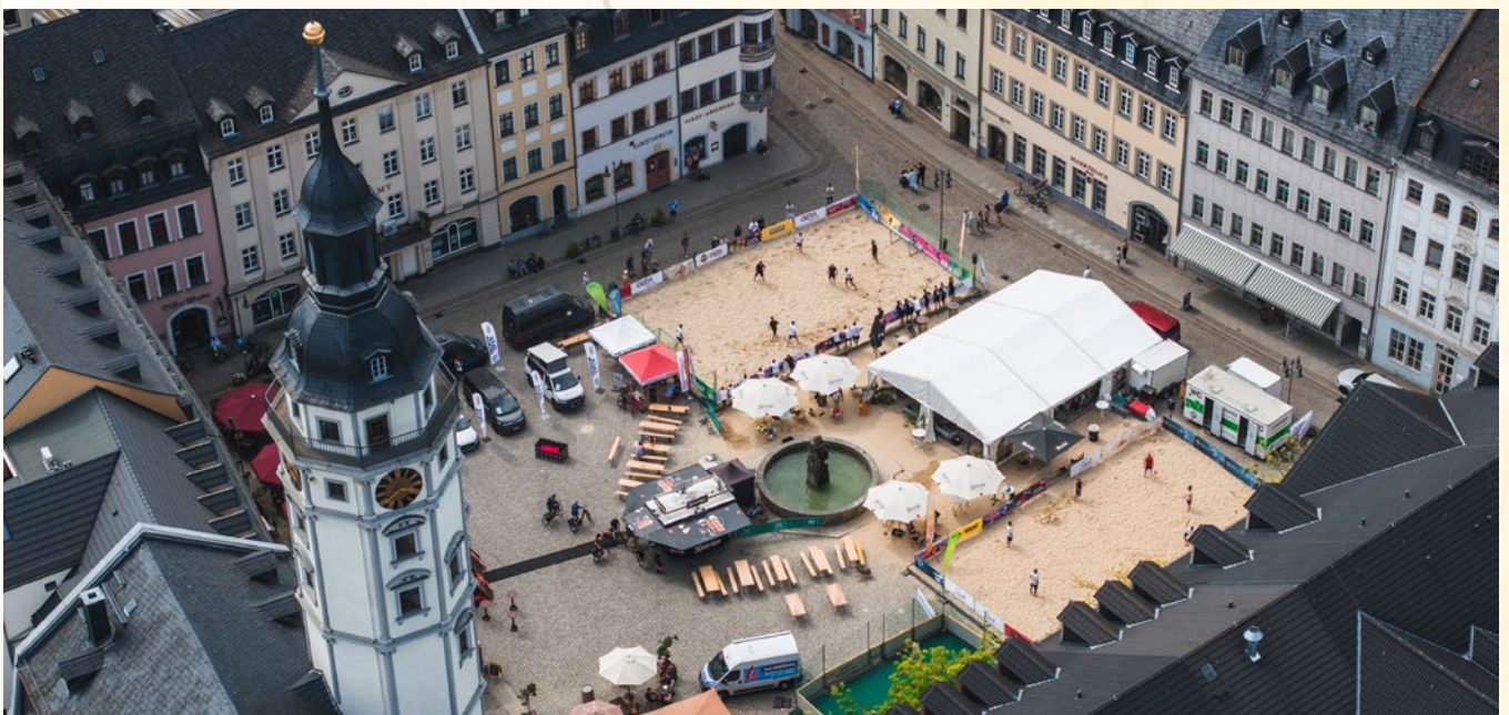
Vom 20. bis 25. August wird auf dem Geraer Markt Beachvolleyball gespielt.