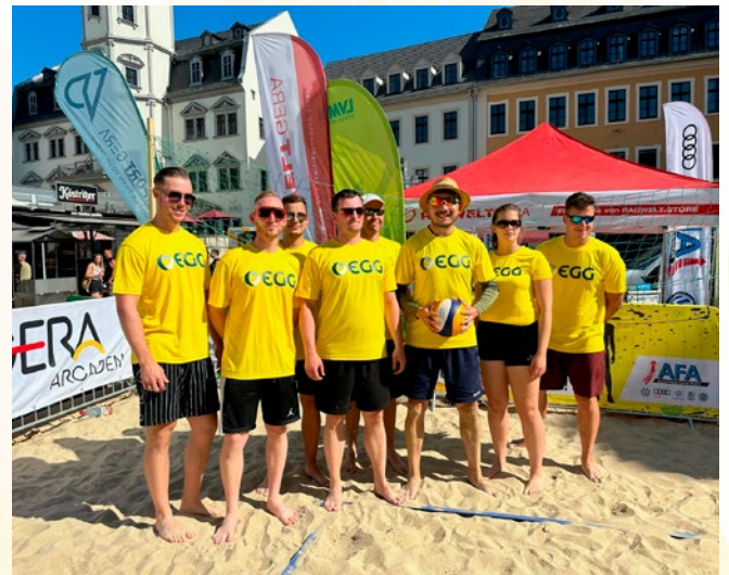
Das Team der EGG beim Firmencup im vergangenen Jahr.

Beim diesjährigen Gera Beach haben Sie die Gelegenheit, an vier Abenden spannende Firmencups zu erleben. Besonders hervorzuheben ist der EGG-Cup am 20. August 2024, der im Rahmen des Sponsorings von der EGG seinen Namen erhält. Ab 17 Uhr können bis zu 10 Mannschaften gegeneinander antreten und in packenden Volleyballturnieren um den ersten Platz kämpfen. Kommen Sie vorbei und feuern Sie die Teams an.