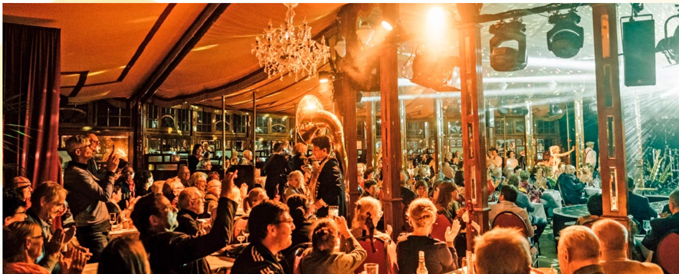
Das Spiegelzelt garantiert ein ganz besonderes Ambiente – in diesem Jahr im Stil der 50er Jahre.