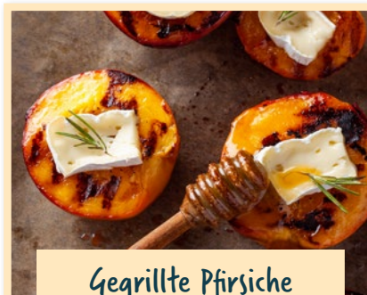
Gegrillte Pfirsiche mit Camembert