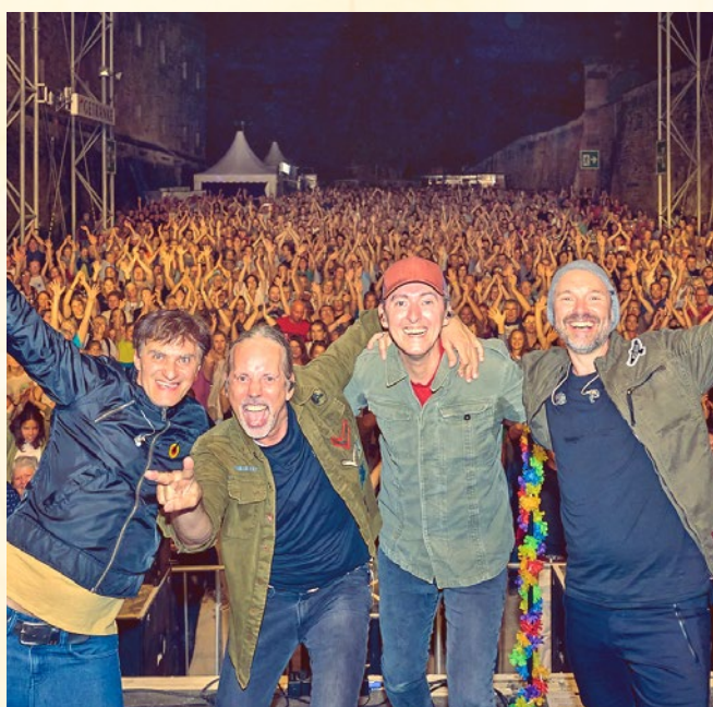
Goldplay spielen am 17.08. bei Sommer im Park.